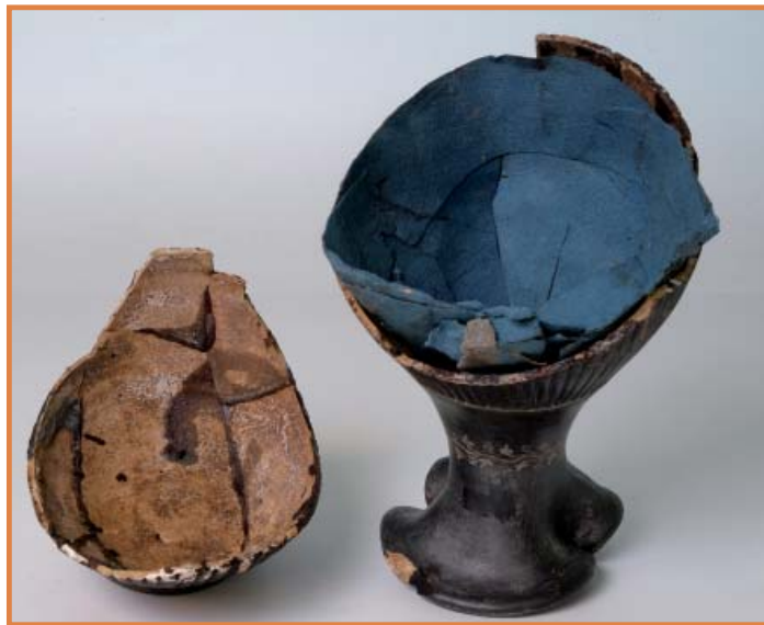
Enoché à bec trilobé. III e siècle avant J.-C.

Plusieurs siècles de restaurations illusionnistes et de dérestaurations ont ainsi enrayé les indices de datation des restaurations antérieures.