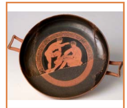
Coupe à l'Héraklès à figures rouges après restauration. Attique. 400-375 avant J.-C. Collection De Clarac.