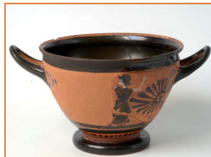
Skyphos à figures noires rehauts rouges et blancs après restauration. IV e siècle avant J.-C.

En marge de l'exposition, deux vitrines offrent au public une accumulation de vases. Cette présentation singulière permet de prendre conscience en totalité d'une part de l'importance du travail accompli par les restaurateurs et d'autre part du nombre conséquent de vases encore en attente de restauration.