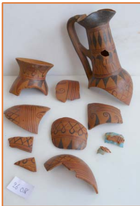
Enoché à embouchure trilobée proto-attique démontée pour les besoins de la restauration. Milieu du VII e siècle avant J.-C.

La restitution de ces vases au public, pour certains après un séjour de plus de 40 ans en réserve, est un parcours initiatique, mis en scène dans l'exposition, qui tente de saisir le fil de leur histoire, depuis leur découverte jusqu'aux vitrines du musée.