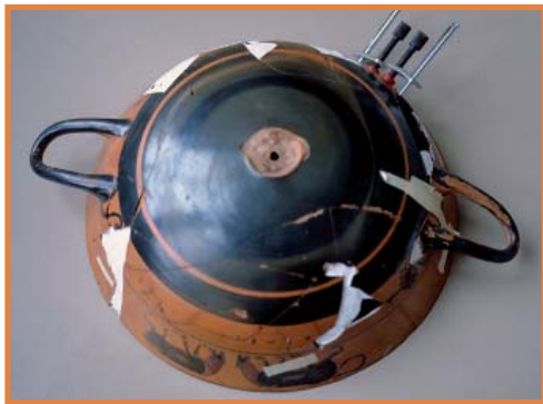
Coupe d'Hermogénès en cours de restauration. Collection Campana

Cependant aujourd'hui on préfère colorer les réintégrations dans la couleur environnante afin de ne pas tromper le regard.