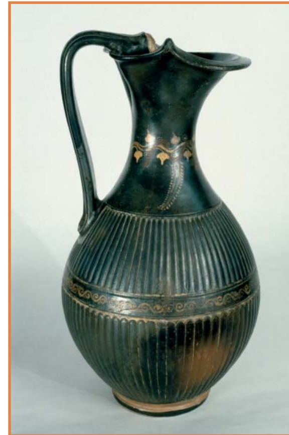
Cenochoé de Gnathia.

Laboratoire de restauration-conservation Materia Viva (Toulouse)