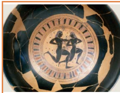
Coupe d'Hermogénès après restauration. Collection Campana

L'atelier de restauration procède par étapes et documente toutes les interventions : décodage des faux, suppression de traces d'enfouissements et de repeints, consolidation en laissant apparentes les parties lacunaires.