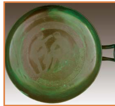
Coupe à l'Héraklès sous rayonnement UV

Ainsi, la partie authentique a pu être révélée et distinguée de la partie qui avait été restaurée de façon multicouches.