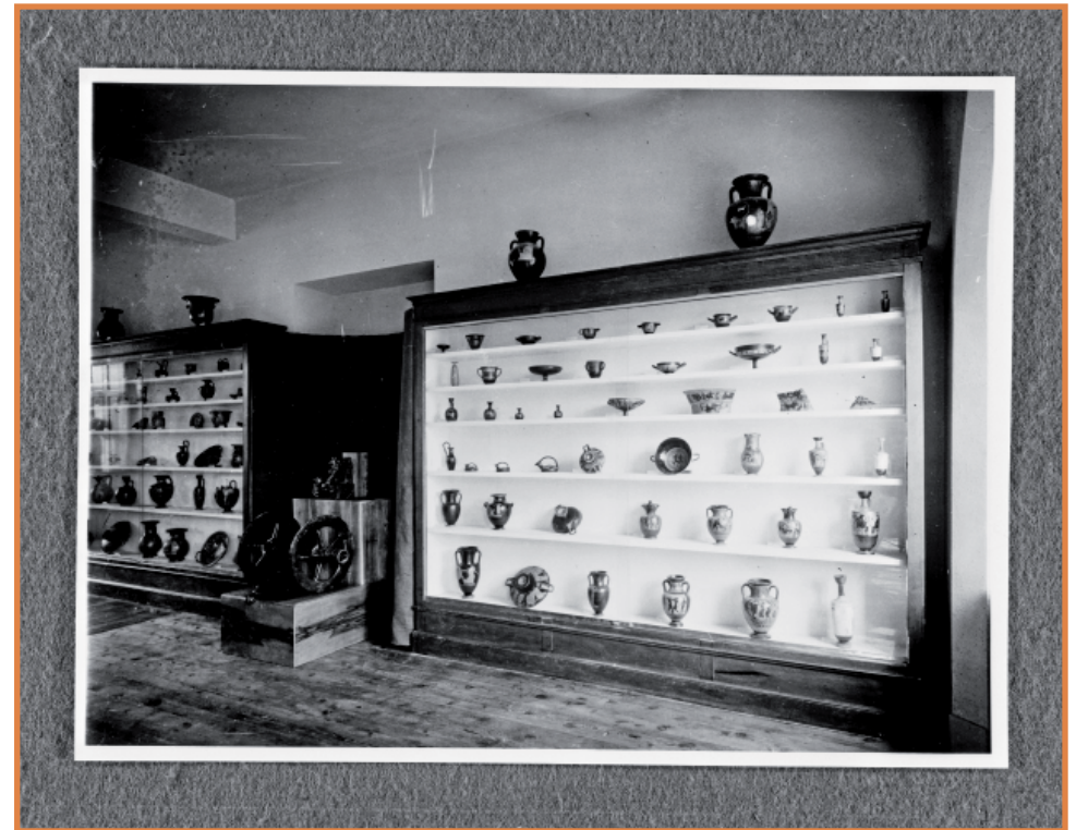
Présentation de la collection des vases grecs réalisée par Robert Mesuret, ancien conservateur du musée.

C'est donc à leur seconde vie que s'attachent les conservateurs d'aujourd'hui.